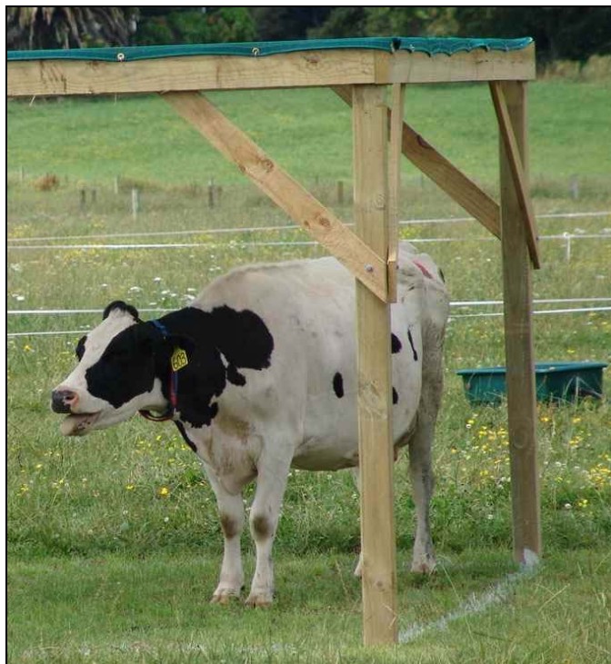
Vache montrant des signes de stress

Dans les grands pâturages, le bétail devrait avoir aisément accès à l'eau. Ajoutez des réservoirs supplémentaires, au besoin. Dans des conditions normales, la distance maximale recommandée que le bétail devrait parcourir jusqu'au point d'eau est comme suit :